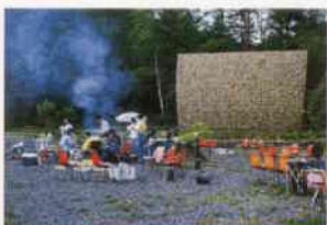
バーベキュー広場